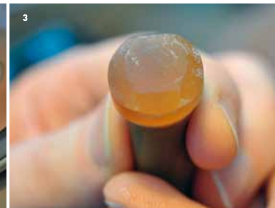
3 Nach dem ersten Schleifdurchgang lassen sich die Hauptfacetten bereits erkennen