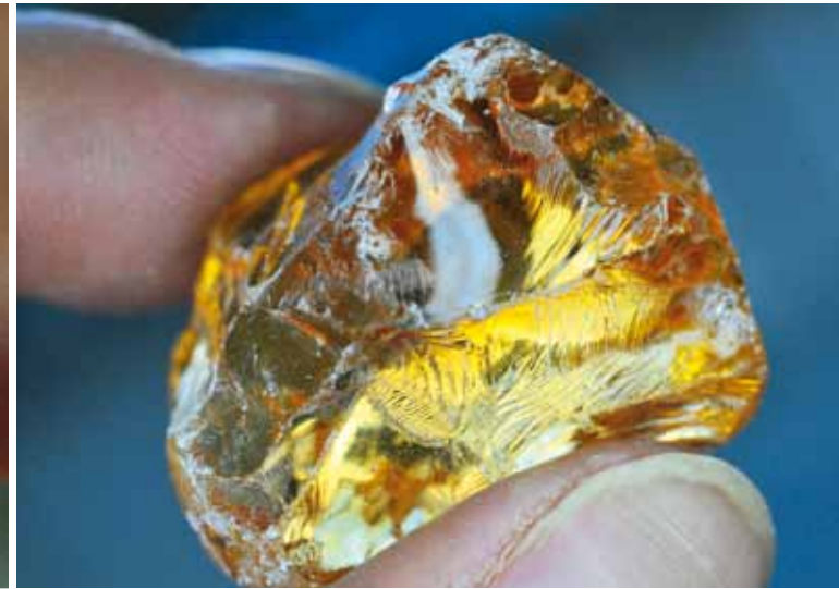
Verschiedenste Rohsteine, die bei Groh + Ripp Schritt für Schritt zu geschliffenen Schönheiten werden