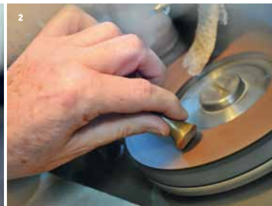
2 Anschließend wird der Stein unter leichter Erwärmung auf ein Holzstäbchen aufgeklittet. Ohne Anschlag findet der Edelsteinschleifer dann nach jeder Facette die richtige Position