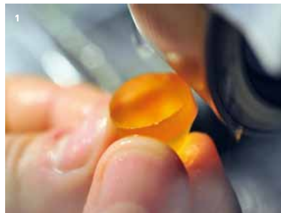
1 Beim so genannten Ebauchieren wird der Imperial-Topas grob in Form geschliffen

Aufgrund der Materialhärte sind Edelsteine, anders als Metall, aufwendiger und nur mit vorheriger Planung zu bearbeiten. Edelsteine unterscheiden sich in ihrer Härte. Mit Mohs bezeichnet man die Ritzhärte, die ein Edelstein einem anderen Material entgegengesetzt. Die höchste Härte von 10 erreicht nur der Diamant, er lässt sich daher auch nur mit sich selbst schleifen. Die Schleifscheiben und Sägen für die Edelsteinbearbeitung sind daher mit Diamant-